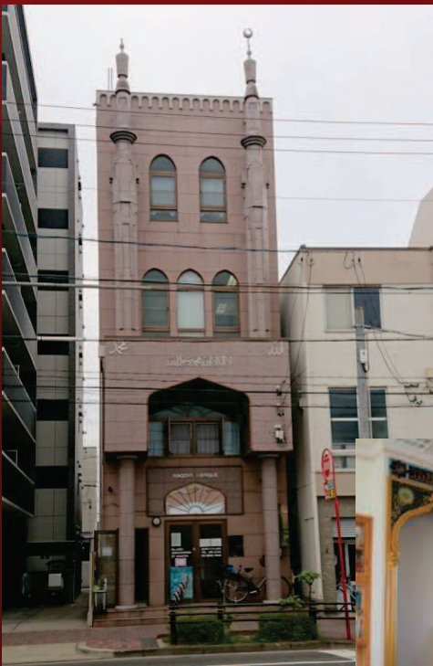
Mesjid Nagoya (Kota Nagoya)