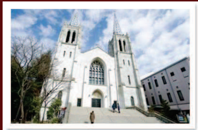
Gereja Katolik Nunoike, Cathedral of St. Peter and St. Paul (Kota Nagoya)