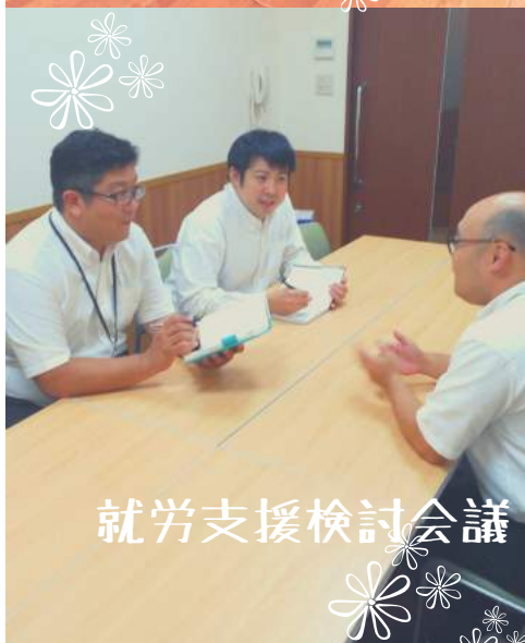
就労支援検討会議