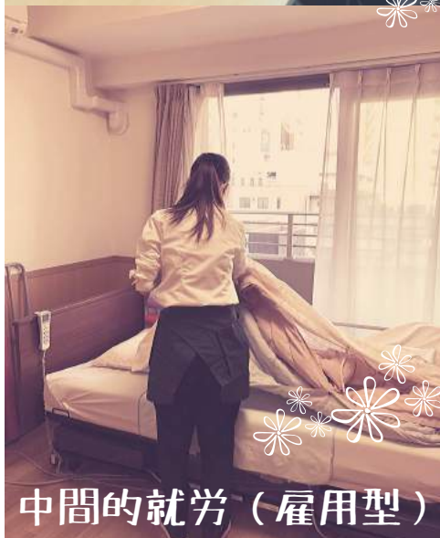
中間的就労（雇用型）