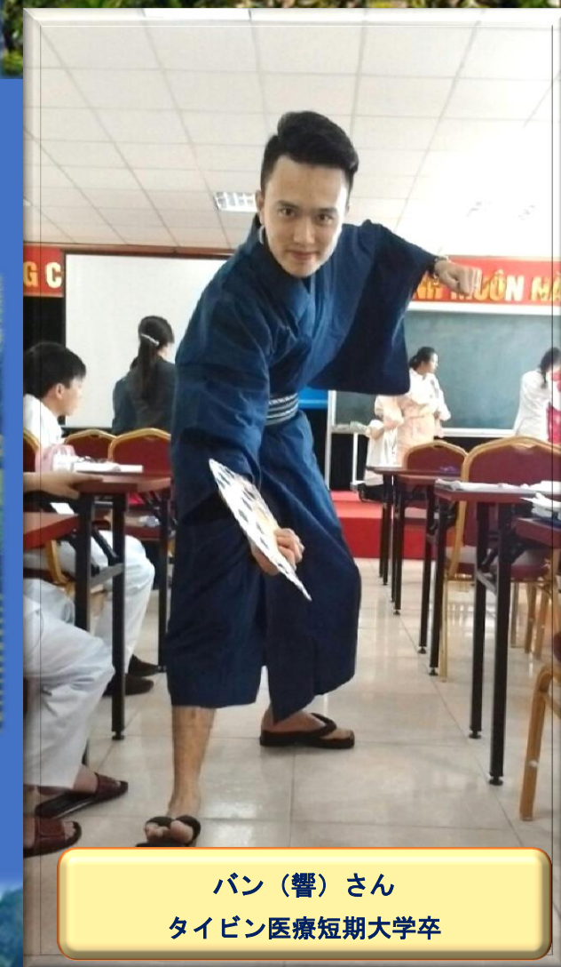
パン（響）さん タイビン医療短期大学卒