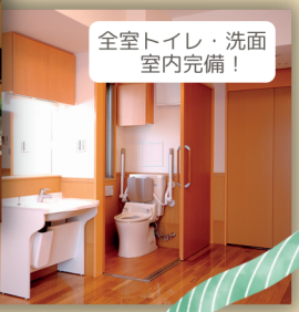
全室トイレ・洗面 室内完備!